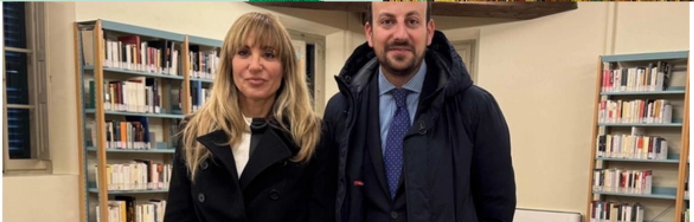
La Biblioteca comunale di Savignano sul Rubicone riapre dopo riqualificazione con investimento di 784mila euro. Inaugurazione oggi alle 16 con eventi culturali e presentazione del progetto di ristrutturazione di Palazzo Vendemini